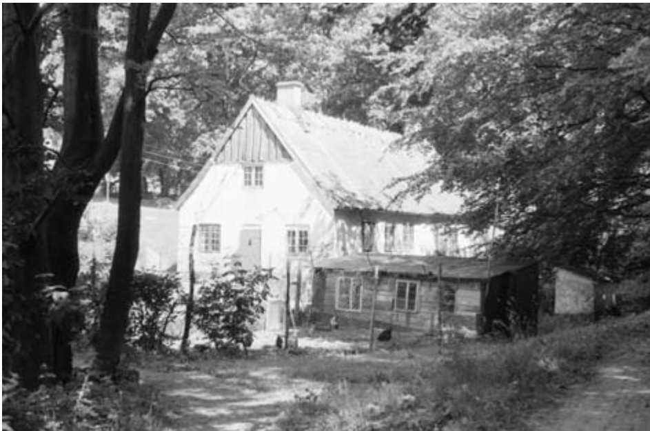
Slibemøllen/spindemøllen, senere skomagerværksted.

Da der under Finansministeriet blev nedsat et udvalg, som skulle stå for afviklingen af Hellebæk Gods, benævnt Udvalget vedrørende Hellebæk