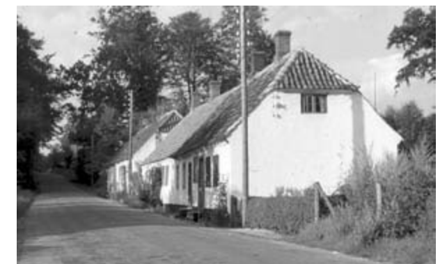
Bøssemagergade 56 - 58. D-0442.