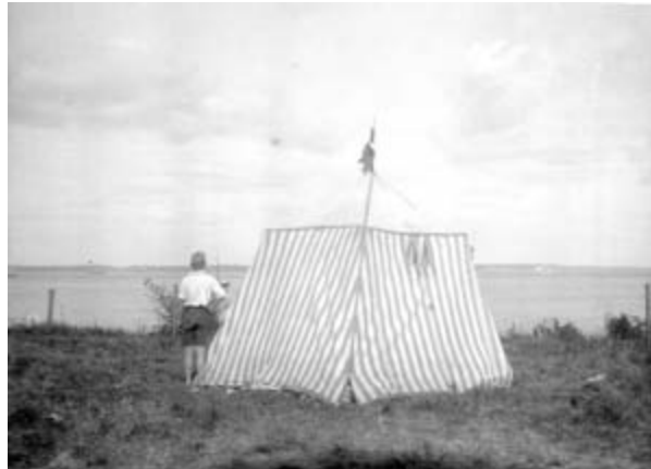
Greven's strandtelt med udsigt til Kullen.

leringen af dem må ikke ændres i henhold til tidligere bestemmelse mellem Det Schimmelmännske Fideikommis og Hellebæk Fabrikker. En udsigtsbakke på et næs i Bondedams vestside er optegnet og skal holdes fri, således at udsigten over Bondedam bevares. Øerne i Bondedam og Bøgeholm Sø fredes med den stående højskovbeplantning. Avlsgårdens landbrugsjord bevares som græsningsareal med forbud mod bebyggelse, opstilling af ledningsmaster m.m. Fredningerne skal ikke hindre Forsvarsministeriets brug af området til uddannelsesmæssige formål. Publikums adgang til området skal ske i overensstemmelse med naturfredningslovens regler om de staten tilhørende skove, samt efter de bestemmelser, som herom måtte blive truffet af Forsvarsministeriet. I mange år blev græsset slået her og anvendt af Zoologisk Have i København til dyrefoder, siden hen blev Hellebæk Kohave etableret og der blev udsat kreaturer til afgræsning af disse arealer. Et areal kaldet Falden (som tidligere havde rummet sportsplads) nord for Fandens Mose er ligeledes fredet og udlagt som