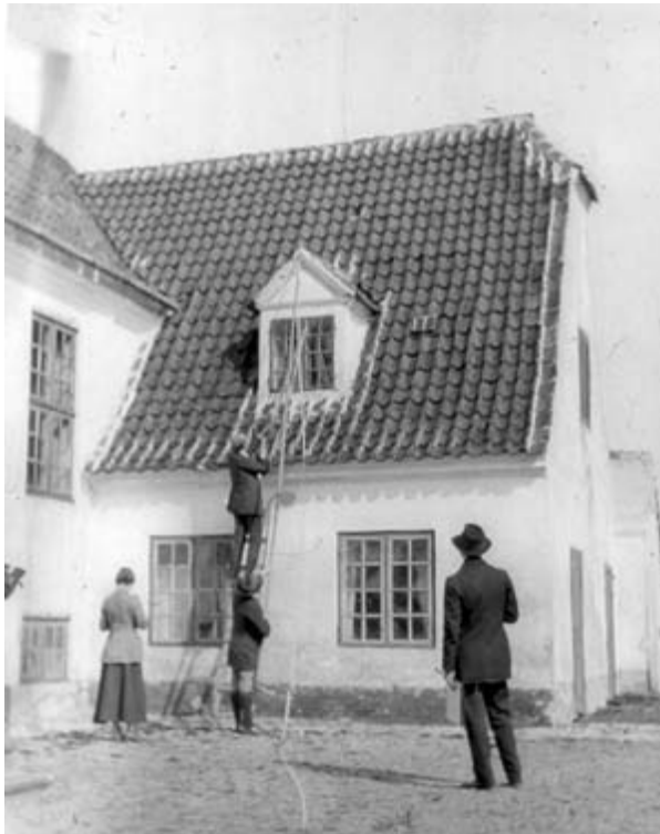
Arkitektstuderende i gang med opmåling af Hellebækgård i 1918. D-0190.

Hellebæk Gods bestod ved konfiskationen i 1948 af 250 tønder agerland, 140 tønder eng og 100 tønder skov - i alt ca. 250 ha – og af mange bygninger både i Hellebæk og i Ålsgårde. Da staten blev ny ejer af godset, skulle der ikke tages hensyn til eventuelle erstatninger ved fredning. Det var derfor let og næsten omkostningsfrit at gennemføre de ønskede bygningsfredninger. Af Hellebæk Gods tidligere ejendomme og bygninger er nu følgende behæftede med tinglyste fredninger.