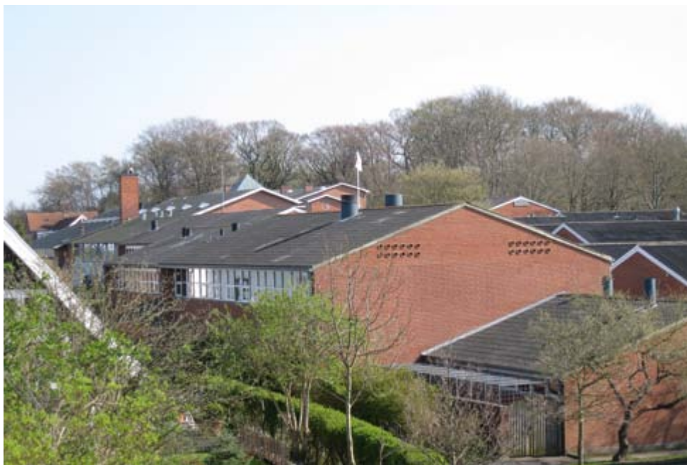
Hellebæk Skole udbygget. Set fra Hellebæk Kirke, i baggrunden den ældste bygning fra 1876.