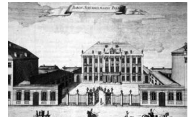
Det Schimmelmanske Palæ i Bredgade, i dag Odd Fellow Palæet.