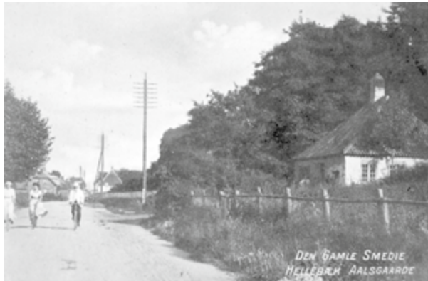
Postkort fra ca. 1900. D-2191.

En søndag eftermiddag kom en københavnsk herre kørende gennem Ålsgårde, da hans hest tabte en sko. Han holdt stille ved smedjen for at få en ny sko slået på hesten. Da arbejdet var færdigt, spurgte københavneren, hvad det kostede. "35 øre", svarede