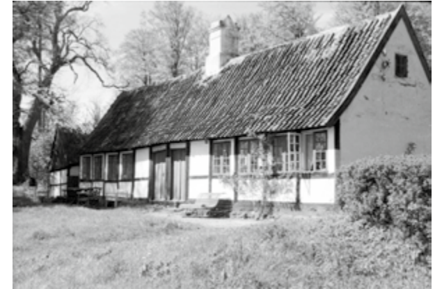
Helbergs Hus, Bøssemagergade 72.