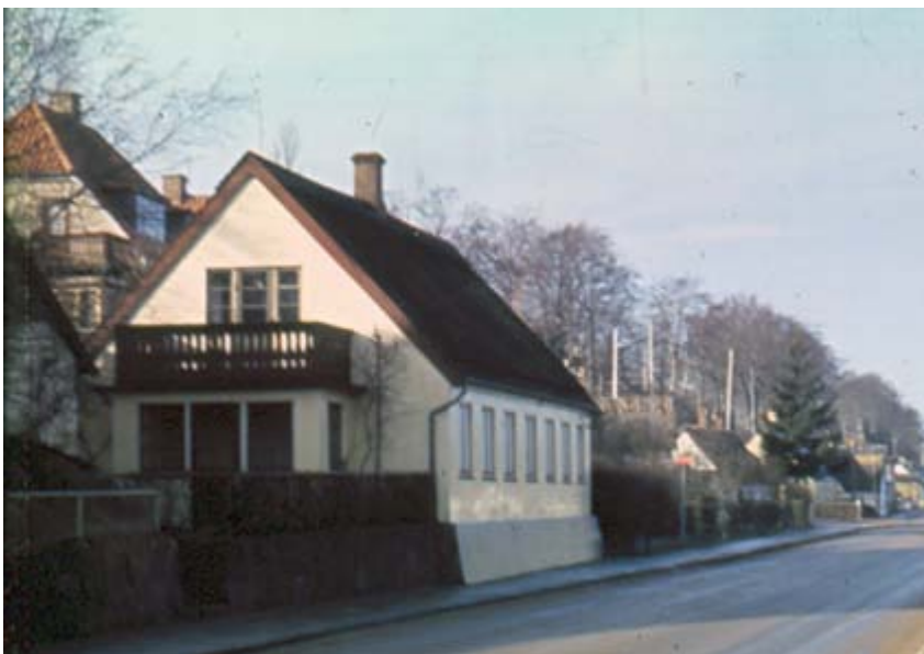
Guldgraverhuset, Ndr. Strandvej 167.