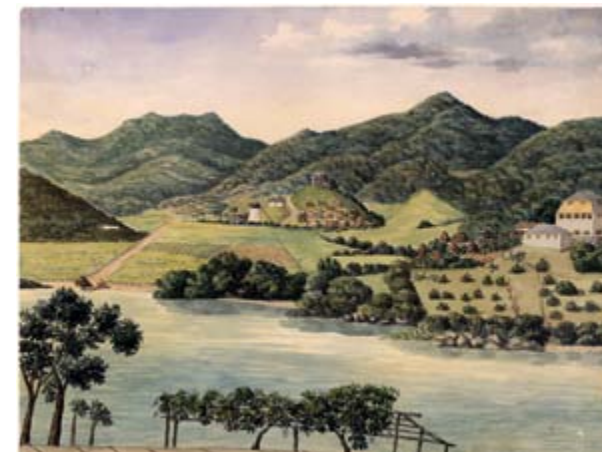
Plantagen Caroline St. Jan, Sept. 1833. M/S Museet for Søfart.

Fideikommiset omfattede oprindeligt 4 plantager 6 i Dansk Vestindien, palæet 7 i Bredgade, sukkerraffinaderiet 8 på Christianshavn, Kronborg Geværfabrik og Hellebækgård med tilhørende jorder, fiskerlejet Ålsgårde, vandrettigheder i Teglstруп Hegn og Hammermølle Skov. I 1870 ved Kronborg Geværfabriks nedlæggelse blev de østlige jorder med Remingtonfabrikken 9 , vandrettigheder og en del af arbejderboligerne frasolgt til jægermester Saxtorph 10 . Det Schimmelmanske Palæ i Bredgade blev frasolgt i 1884.