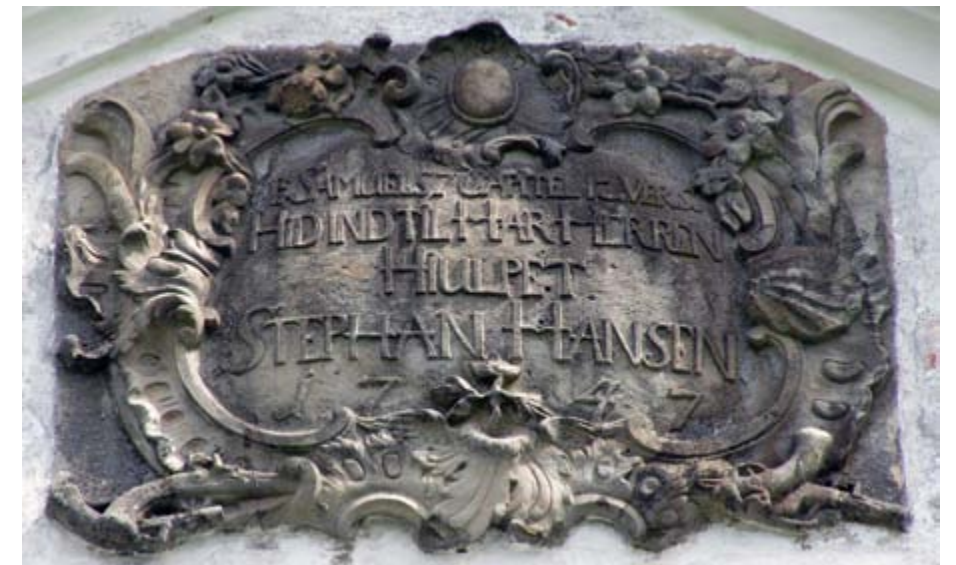
Sandstensrelief med Stephan Hansens motto. Opsat på Palæets frontispice mod vest.

Ved opgravningen af den store kælder under kappellet, som tidligere havde fungeret som ligkappel,