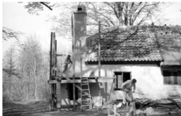
Murermester Oscar Amelung i gang med restaureringen af Proberhuset.

Overfor Mesterboligerne i Bøssemagergade ligger det nu fredede Proberhus, bygget 1856, hvor geværløbene indtil 1870 blev trykprøvet, inden de kunne gennemgå de yderligere processer med montering