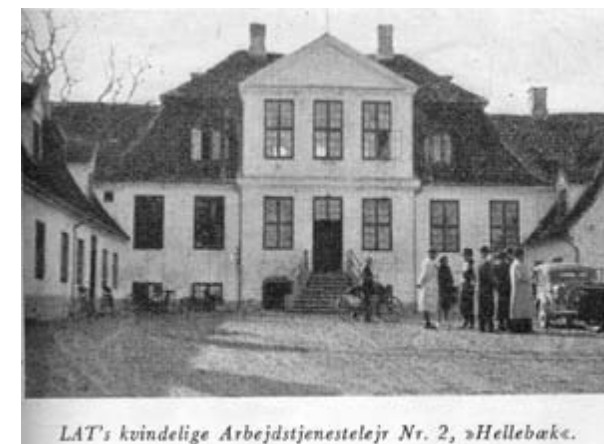
LAT's kvindelige Arbejdstjenestelej Nr. 2, »Hellebæk«.

juni 1944. Tjenesten gik under det folkelige og mere populære øgenavn "Spadesvingerne". Mændene i tjenesten eksercerede med spader, som om det var geværer. LAT var en organisation for både mænd og piger, som man på den tid benævnte ugifte kvinder.