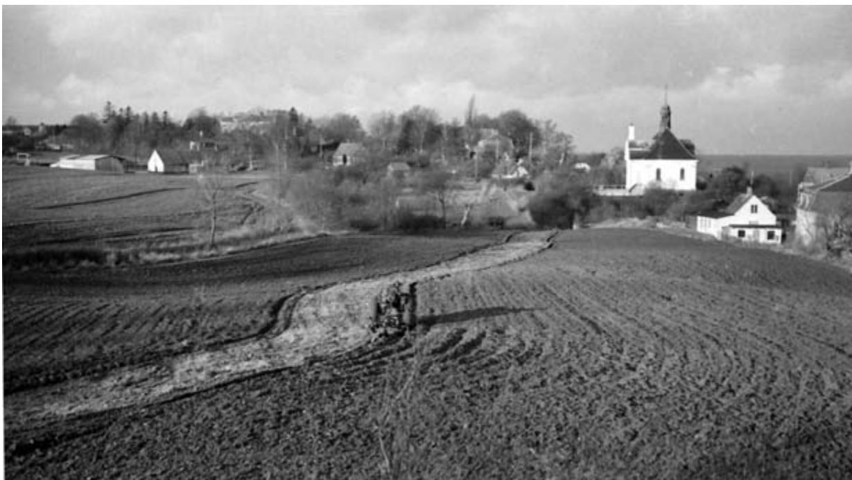
Teglværksgårdens jorder set fra Hellebæk Skole, til venstre Teglværksgården med fodboldbanen bagved, midt i billedet pension Solbakken og Solnæs, yderst til højre ses Villa Macson. Foto: J.U. 1952.