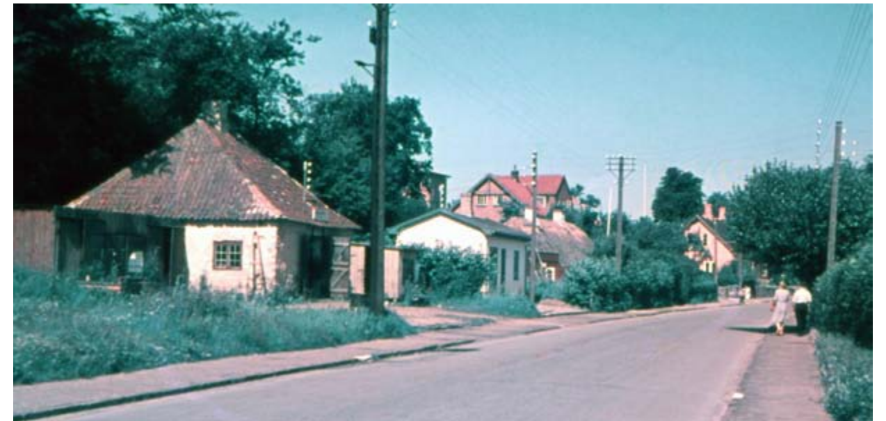
Ndr. Strandvej sommeren 1945 fra venstre ses Hellebæk Smedje, P.G. Selanders elforretning, Hellebæk Skole oven over Lerhuset og Ljunggrens hus.