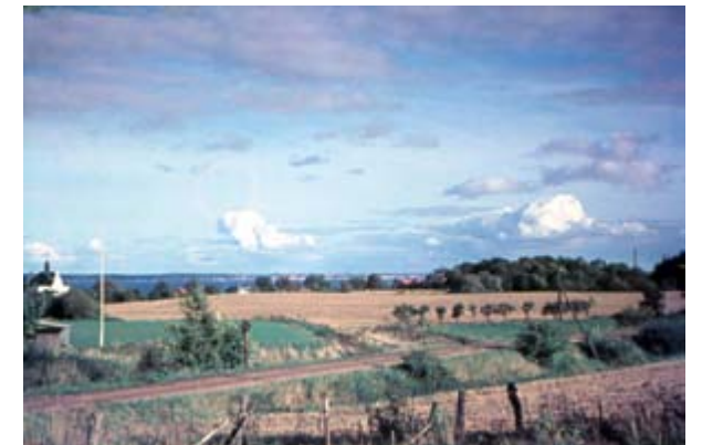
Teglværksgårdens jorder set fra syd, hvor nu Carsten Hauchs Vej, Lergraven og Alexander Svedstrups Vej er beliggende.

Tikøb Kommune havde ladet et stykke jord fra