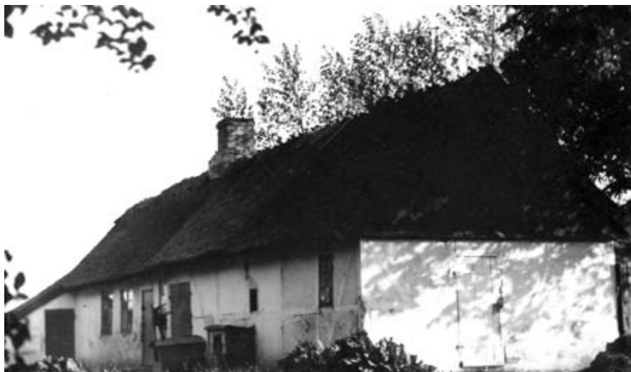
Petermandshuset. B785.

Huset blev under meget store protester nedrevet i 1990 af ejeren, d.v.s. Forsvarsministeriet. Der var flere, der prøvede at redde huset fra nedrivning, men Forsvarsministeriet forklarede, at huset lå i umid-