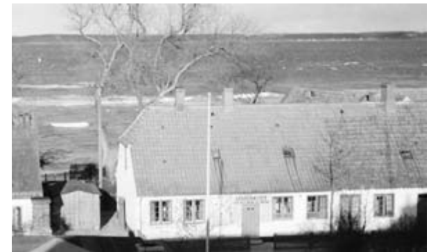
Ndr. Strandvej 120, set fra Hellebæk Skole.

og var oprindeligt opført som arbejderboliger til arbejderne på strømpefabrikken, som fra 1822 lå på Majorgårdens område. I 1847 blev Aalsgaard Skole etableret i bygningen, og lå her indtil den nye skole i 1876 blev bygget overfor, oppe på skrænten.