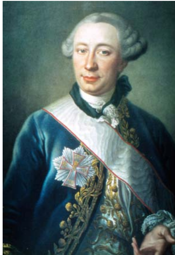
Heinrich Carl Schimmelmann, ca. 1762, malet af Stefano Torelli.