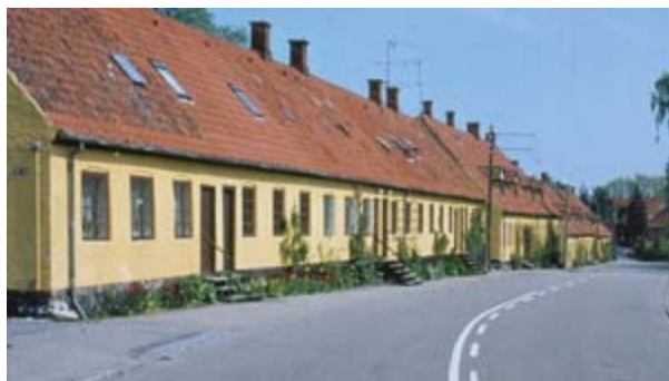
Skæftergården og Mesterboligerne i Bøssemagergade. Foto S.E. D-0110.

Fabriksgaden henlå i 1948 stort set uforandret med værkstedsbygningerne på den vestre side af Bøssemagergade og den modsatte side ved Mælkedam ubebygget. Bøssemagergades gamle gule huse med røde tage blev kaldt Tallerkenrækken. De indeholdt tidligere kombinerede værksteder og beboelse og stod udvendig stort set stadig som da de blev bygget i 1700-tallet. Husene havde været udlejet af godset til beboelse siden geværfabrikens ophør i 1870. Man frygtede, at der ved salg ville blive forandret meget