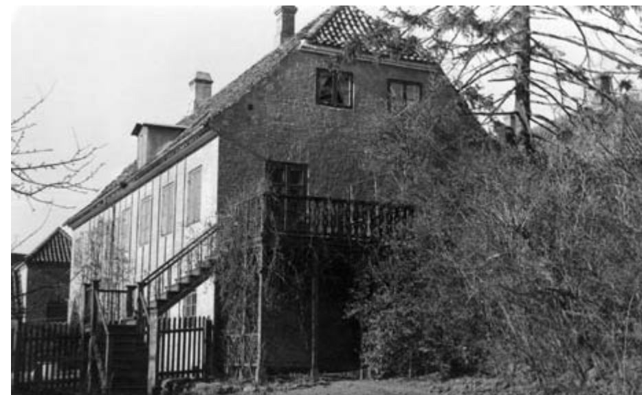
Probermesterboligen set fra haven, 1953. Foto: J.U. B1471.

Hver af Mesterboligerne var i geværfabrikens tid indrettet med 2 værksteder og 2 beboelser. I midten af huset var boligerne indrettet spejlvendt for hinanden med stuer og køkken. På førstesalen lå soveværelserne, hvor lærlinge og ugifte svende overnattede. I gavlene var værkstederne for geværfremstillingen placeret. Her var mindre smedjer, hvor alle de håndmedede dele til geværene kunne fremstilles. Hver bøssemagermester arbejdede i sit eget hus. I værkstederne blev der udover geværer af mange slags også fremstillet pistoler, bajonetter og sabler. Flere af processerne ved fremstillingen blev udført i andre værksteder, hvor der var maskineri, som blev drevet med vandkraft fra Hellebækken, således smedning, boringen og slibningen af geværløbene og slibning af ladestokke og bajonetter. Geværernes skæfter af træ blev fremstillet i Skæftergården. Udover selve smedearbejdet i værkstederne var der andre opgaver,