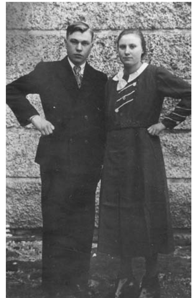
Det bessarabiske brudepar foran Hellebæk Kirke. B1590.

D.F.D.S.s damper "Cimbria" 52 ankom i Gaar til Helsingør Havn for at hente de bessarabiske Flygtninge, 512 ialt, der hidtil har været indkvarteret paa „Hellebæk Badehotel". „Cimbria" sejler Flygtningene til Fredericia, og derfra gaar Rejsen videre med Særtog til Nymindegab ved Jyllands Vestkyst, hvor Bessara-