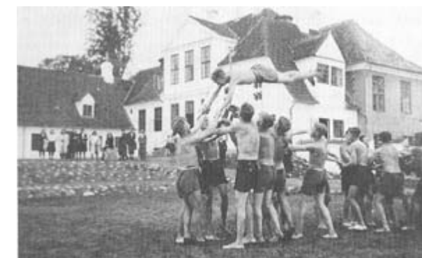
Gymnastik på førerskolen i Hellebæk.

De synes ganske at glemme, at ogsaa Danmark har tilsluttet sig Antikominternpagten, der betyder Kamp mod Kommunismen og mod den bag denne staaende Verdensjødedom, og ved en Optræden som den,