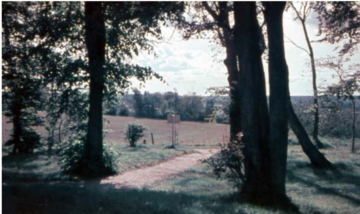
Udsigten ind over land fra Odinhøj i 1955, i dag er Nordskovgårds marker bebygget med parcelhuse.

i løbet af pinsen kom der i de gode år over 10.000 besøgende. Ved Hornbækbanens åbning i 1906 fik Hellebæk station på strækningen, og endnu flere blev bekendt med stedets kvaliteter.