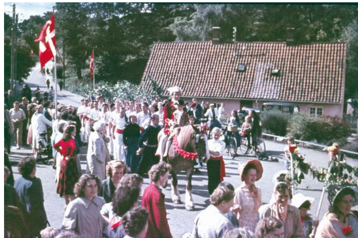
Det store velkomstoptog, majgreven og hans søn til hest foran et regiment "bøssemagere".

Skolens nye undervisningsbygning blev anbragt på grundens nordvestside langs skovvejen, efter at