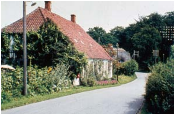
Pension Bondedam.