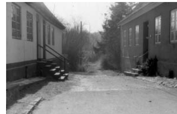
Caroline Mathildes Vej. Politibetjentens Hus til venstre med Probermesterboligen overfor. D-0459.