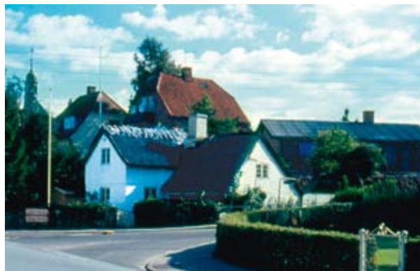
Ndr. Strandvej 171, Havbrus 1966. D-2545.