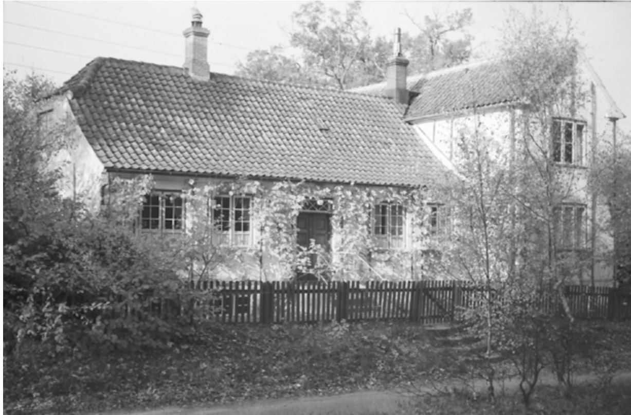
Administratorboligen, Bøssemagergade 60.