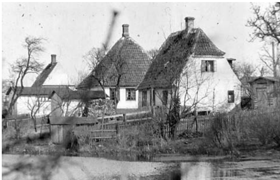
Geværfabrikkens gamle smedje på Fordamsvej. Med sit pyramidetag har den dannet forbillede for Hellebæk Smedje på Ndr. Strandvej. Foto: S.E. D-0141.

Kronborg Geværfabrik havde indtil nedlæggelsen i 1870 sin grovsmedje beliggende i Hellebæk på den nuværende Fordamsvej. Da Det Schimmelmansske Fideikommis i slutningen af 1870 solgte det østlige af sit areal til hofjægermester Saxtorph, fulgte den gamle smedje med i købet. Hellebækgård kunne ikke undvære en smedje til et landbrug med mange heste og markredskaber, som skulle vedligeholdes. Derfor byggede man en ny smedje på et stykke ikke matrikuleret jord på Nordre Strandvej 131. Smedjen blev bygget hen mod midten af 1870'erne, den var færdigbygget 1875, hvor den figurerer med en lejer i fideikommisets protokoller. Flere af fideikommisets ansatte deltog i byggeriet, bl.a. tre landarbejdere 150 , som boede i fideikommisets huse i Hellebæk Vang, mens forpagter Jørgensen på Hellebækgård måtte