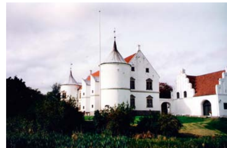
Lindenberg Gods i Himmerland. Godset har været i familien Schimmelmännns besiddelse siden 1762.

Han forsøgte at komme i folketinget ved at lade