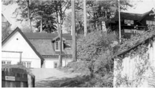
Fra nedgangen til Langebro ses Ønskekvisten øverst til højre.