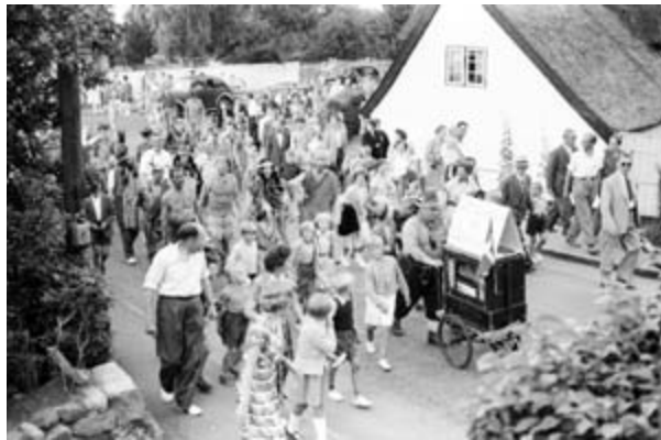
Landliggerkamp 1953. Optøget ved Krogebakke.