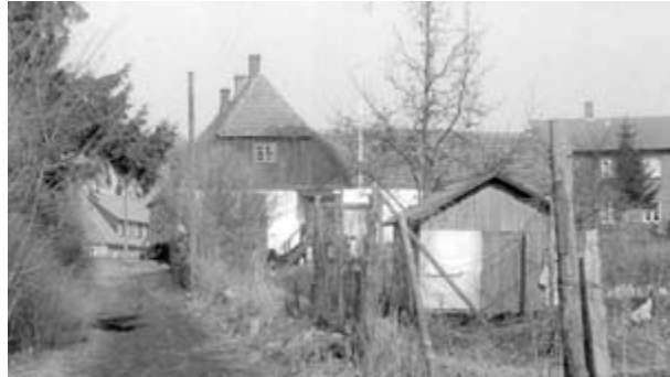
Politibetjentens Hus, Caroline Mathildes Vej 1. Foto: S.E. D-0463.

grøntsager. Han havde fra 1818 til 1873 haft skolestue i Bøssemagergade 32.