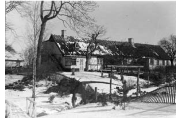
Det Lave Hus, Ndr. Strandvej 112 - 116.

Nr. 120 har matriklen 30b i Ålsgårde ejerlav