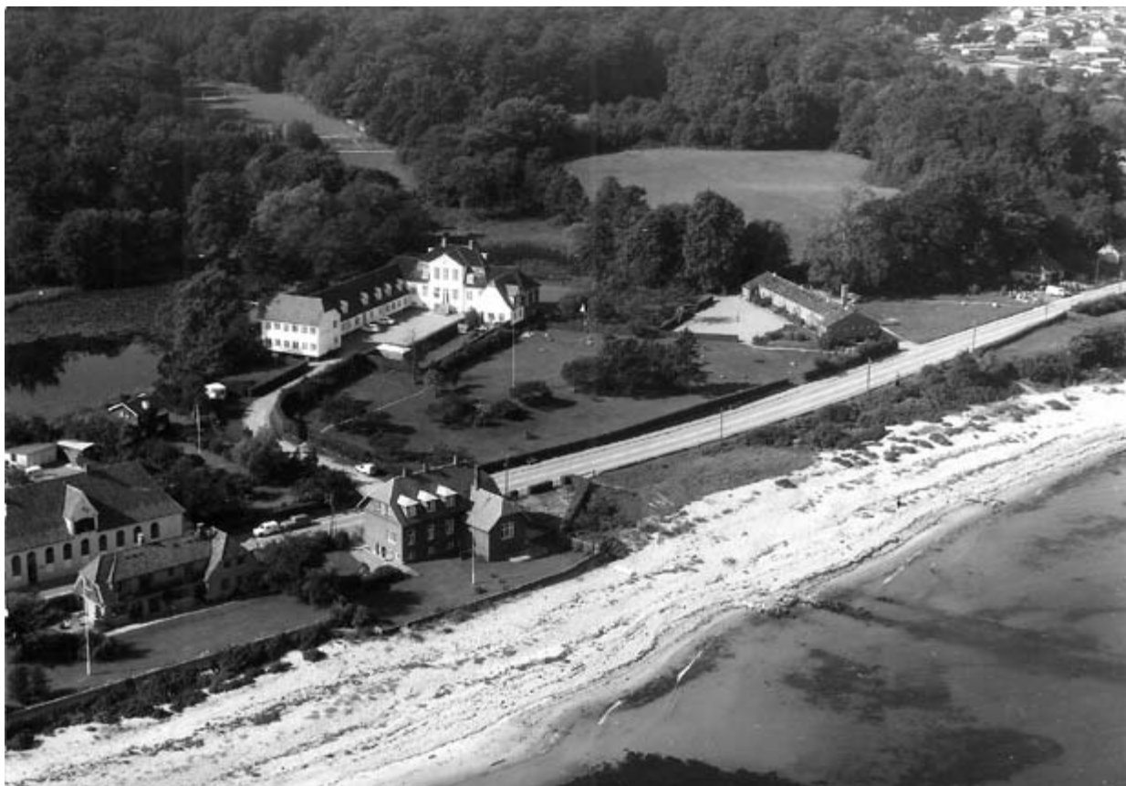
Hellebækgård, Skorpeskolen set fra luften ca. 1960.

Første januar 1952 blev Hellebækgårds bygninger og en del af dens omgivelser på 18.785 m 2 solgt for 120.000 Kr. til Det Kongelige Opfostringshus og Den Thorupske Stiftelse, en ærværdig gammel kostskole og institution indstiftet af Frederik V i 1753. Skolen havde til formål at give opvakte drengebørn af enlige forældre gratis skolegang, mad og klæder og sørge