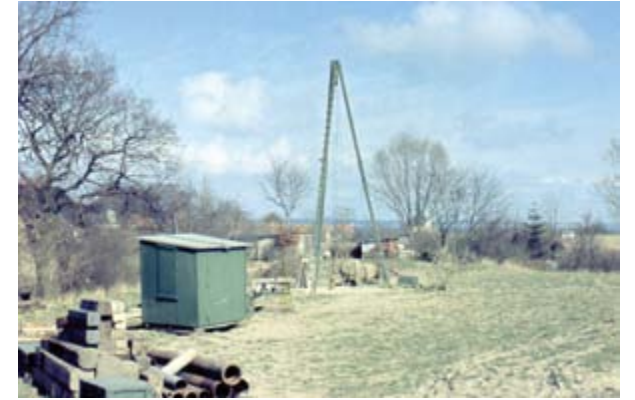
Vandboringen på Krogebakke.