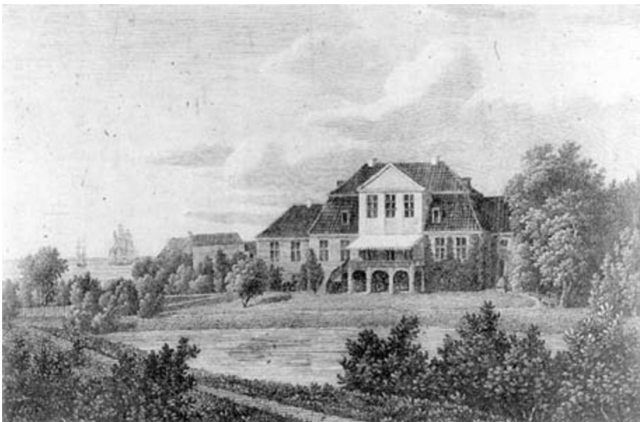
Hellebækgård ca. 1830. Efter gl. stik af A. Hansen. D-0171.