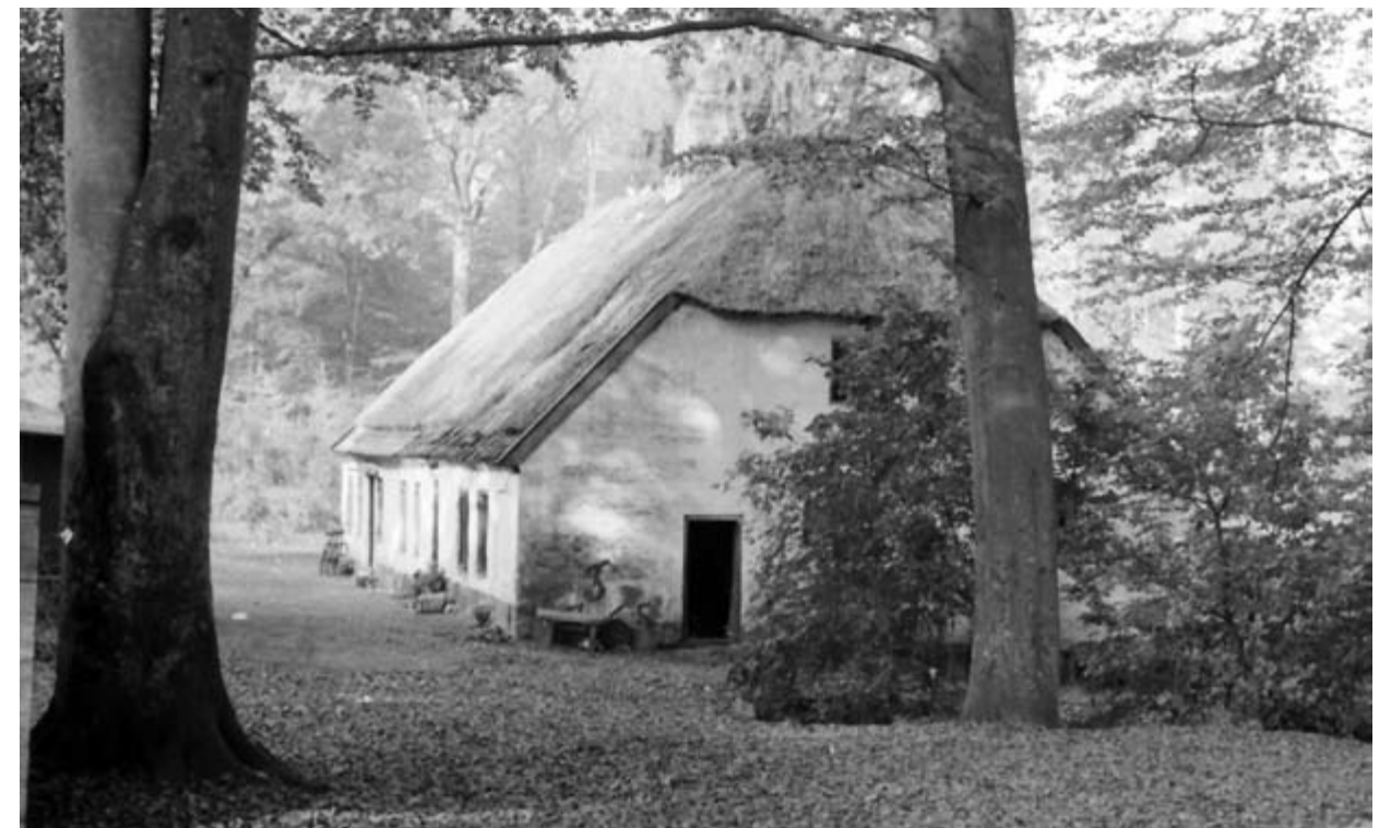
Hammermøllen 1950.

Ved geværfabrikkens nedlæggelse i 1870 blev mølleværket fjernet og bygningen anvendt som bolig for flere familier. I 1960 begyndte Hellebæk-Aalsgaard Egnehistoriske Forening at rekonstruere den gamle hammermølle. Efter 22 års indsats med økonomisk støtte fra flere fonde kunne man i 1982 genindvie Hammermøllen, som nu indeholder museum og egnehistorisk arkiv. Bygningen blev fredet i 1960.