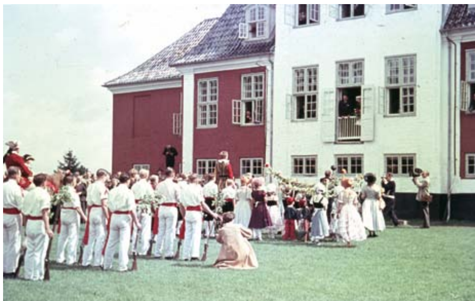
Skorperne blev budt velkommen til Hellebæk med et storstilet optog af byens borgere inspireret af bøssemagernes traditionelle pinseoptog. Narren måtte "nøjes" med at holde tale for kongeparret i stedet for greven.

Elevernes sovesale blev indrettet dels i sydfløjen, som vendte ud mod Hellebæk Fordam og skoven, dels i det gamle kapel, som havde stået tomt siden nedlæggelsen i 1920, da alt kirkeinventaret, stolerækker, dåbsfond og -himmel samt prædikestolen blev flyttet til den nye kirke ved Ndr. Strandvej. Arkitekt Rafn havde helst set, at kapellet kunne bibeholdes på