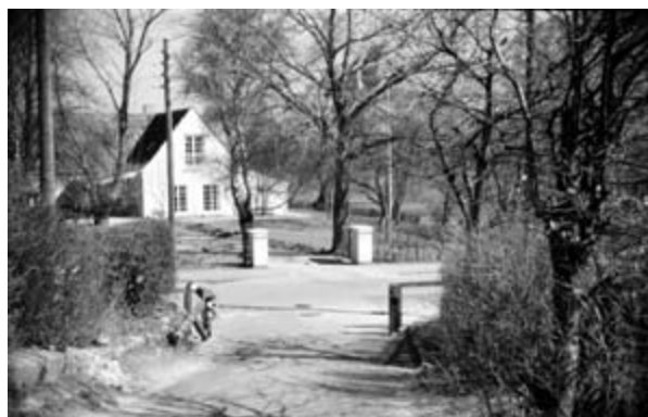
Skolebakken, tilkørslen til Hellebæk Skole fra Ndr. Strandvej. Foto: J.U. 1952.

Grundene var bl.a. et areal ved Langebro under matr. 46, som fik en servitut, som pålagde køberen