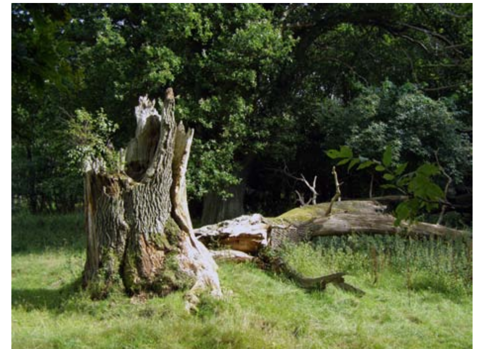
Med tiden er flere af de gamle fredede ege gået til. 2012.