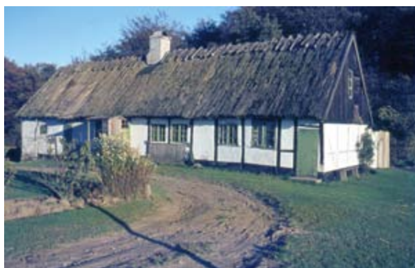
Engvangshuset.