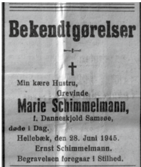
Dødsannonce i Helsingør Dagblad.