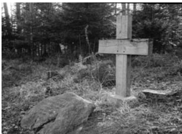
Greve Werner Ernst Carl Schimmelmans gravsted på øen i Bondedam.

Vi har ingen underretninger om fuldmægtig Olsen måtte til lommerne for at tilfredsstille den hid-sige grev Ernst.