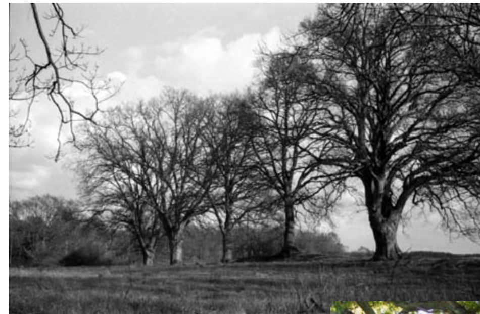
De fredede ege i markskellet på Hellebæk Vang i 1952 og i dag.

Udstykning af arealerne til eksempelvis flere landbrug, fabriksbygninger eller sommerhuse, som skød op alle steder dengang, ville påføre området et helt nyt udseende. Der blev derfor foreslået en fredning af arealerne med det formål at sikre de landskabelige værdier i området og befolkningens adgang til disse. Danmarks Naturfredningsforening rejste derfor 5. januar 1951 fredningssag, som resulterede i kendelse af 8. februar 1952 afsagt af Fredningsnævnet for Frederiksborg Amt ved Dommer J.L. Buch, Frederikssund og tinglyst 12. februar 1952. Enighed mellem parterne medførte, at fredningskendelsen