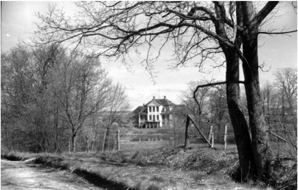
Hellebækgård forår 1948, set fra Roevejen.