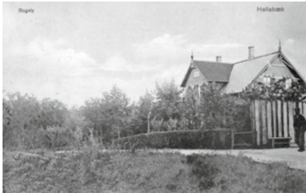
Bøgely, Hellebækvej 139. Postkort. B396.