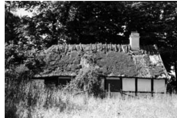
Anes Hus.

Thomsens Hus, blev efter legitimationserklæring af 27. juni 1958 overført til administration af statskovbruget under landbrugsministeriet. De 4 huse var alle udlejede og lejemålene fortsatte uændret.