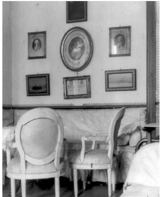
Interiør på Hellebækgård i 1946.

Palæet blev bygget i 1747 til Kronborg Geværfabriks daværende ejer Stephan Hansen. Arkitekten er med stor sandsynlighed Philip de Lange 149 . Hovedbygningen blev med tiderne udbygget symmetrisk til begge