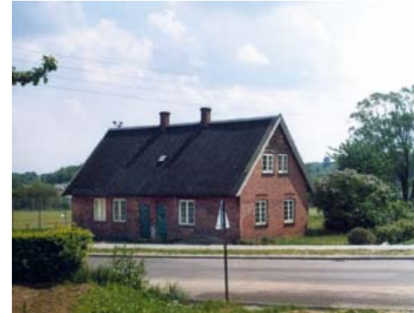
Aalsgaard Teglværks maskinhus på Krogebakke.

det bebygget med parcelhuse. Vejene i udstykningen fik navnene Carsten Hauchs Vej, Lergraven og Alexander Svedstrups Vej.