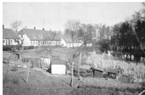
Haverne mellem Mælkedam og Bøssemagergade.

I efteråret 1952 fremkom et ønske fra statens side om at få etableret en sti langs jernbanesporet fra Bøssemagergade og til skoven. Derfor forhandlede der frem til et mageskifte, hvor andelsboligforeningen afgav et 6 – 8 meter bredt jordstykke langs jernbanen