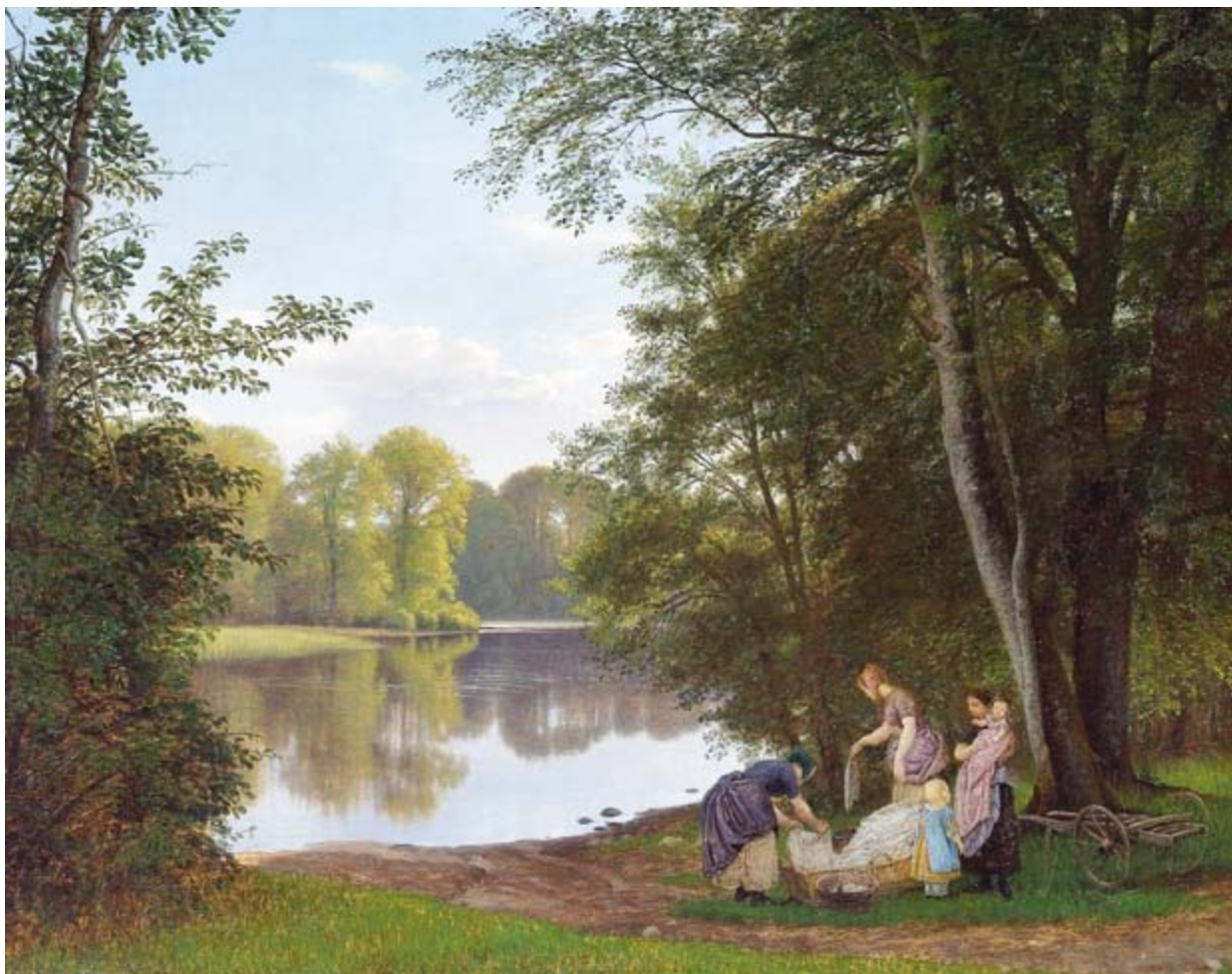
Peter Christian Thamsen Skovgaard (1817-1875): "Stille Sommeraften ved en Indsø". Bondedammen i Hellebæk, unge mødre vasker tøj. 1857-1860. Privateje.

Hellebæk er skønt beliggende ved Øresund med udsigt til Sverige, Teglstrup Hegn og Hammermølle Skov med de store bøgetræsbevoksninger, som gror helt ned til de mange skovsøer i det kuperede landskab skabt for årtusinder siden af den sidste istid. Byen og egnen har gennem tiden tiltrukket både ma-