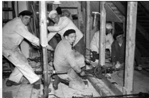
Håndværkerne i gang med loftetagen på sydfløjen.

En istandsættelse var nødvendig, og omstillingen til kostskole for 80 drenge blev iværksat med skolens faste arkitekt Aage Rafn 144 , en erfaren herre med mange smukke huse bag sig, blandt andet sta-