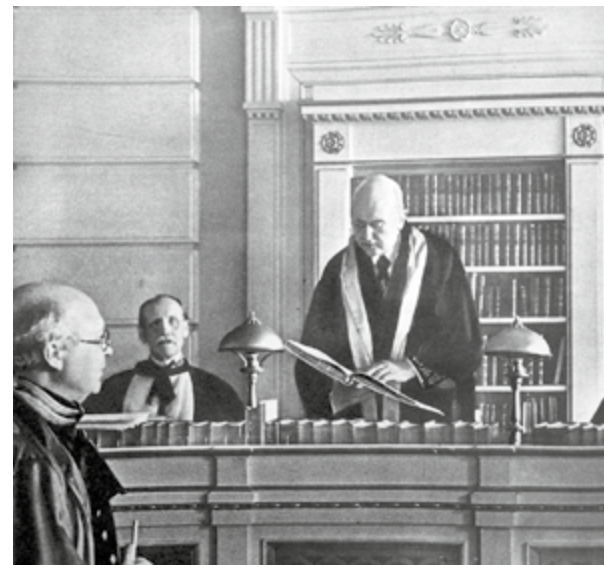
Højsteretspræsident Troels Jørgensen oplæser en dom i Højsteret i 1940.

Tiltalte blev dømt for 2 af førnævnte tilfælde, nemlig sit medlemskab og tillidsposter indenfor DNSAP og sit tilhørsforhold til dagbladet ”Fædrelandet”. Dommen kom til at lyde på 2 års fængsel, hvoraf 1 år og 158 dage ansås for udstået under in-