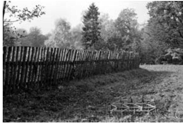
Marken bag Administratorboligen.