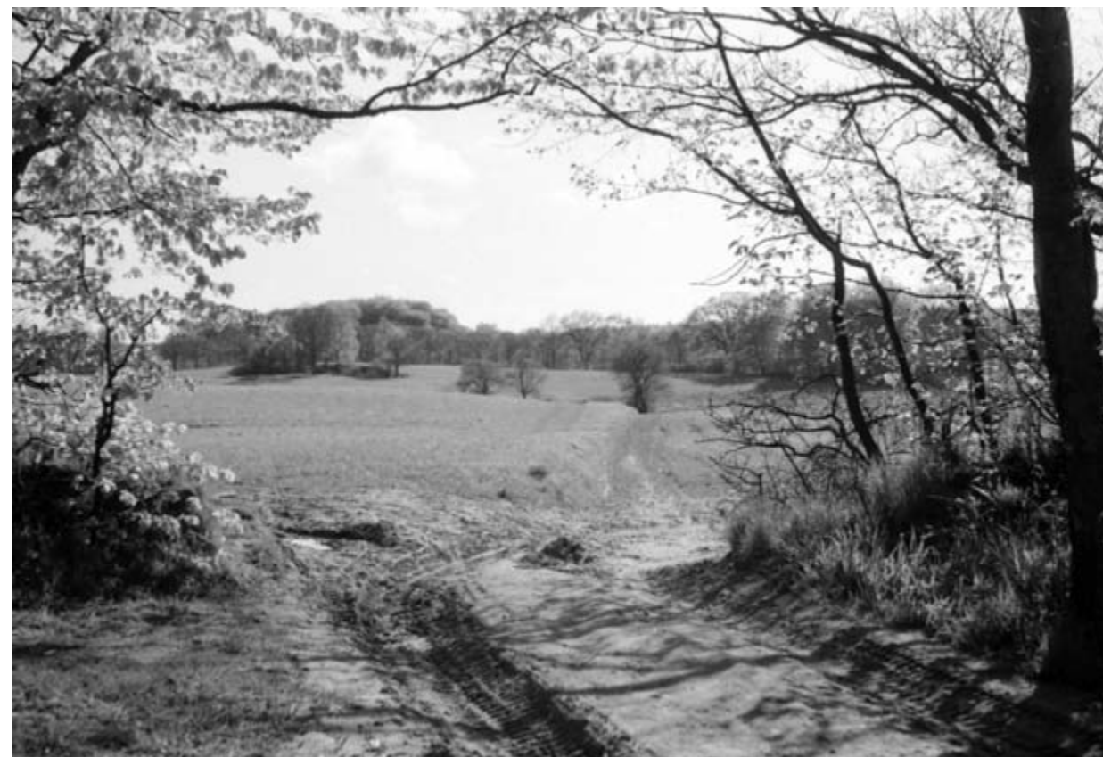
Hellebæk Vang en forårsdag i 1952, set fra Pernille Låge. Disse arealer overtog Forsvarsministeriet til øvelsesterræn efter konfiskationen.

lere og forfattere, som bidrog til kendskabet til Hellebæks natur. De kendte malere P.C. Skovgaard, Carl Bloch og mange andre fandt deres bedste motiver i denne egn, som havde Guldalderens ideelle storslåede natur med bøgeskovens lysåbne sale, ensomheden og søernes idylliske skovbrømmer, som spejlede og