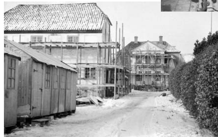
Ombygningen af Hellebækgård er godt i gang i vinteren 1952, skure til håndværkerne og stilladser er rejst.

tionsbygningerne på Bornholm og Politigården i København. Hellebækgårds ombygning skulle blive hans sidste arbejde, han døde i 1953 som 63-årig, få måneder før indvielsen af skorpedrengenes nye omgivelser.