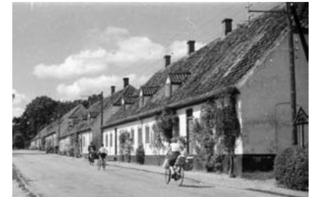
Bøssemagergade 26 - 48, Mesterboligerne og Skæftergården i baggrunden.

Dette forslag blev dog langt fra gældende. Statens udvalg valgte selv at tage flere ejendomme ud og sælge dem særskilt, og da hver enkelt lejer skulle skrive under på, at de ville købe deres lejede bolig, blev listen minimeret.