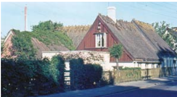
Ndr. Strandvej 160.