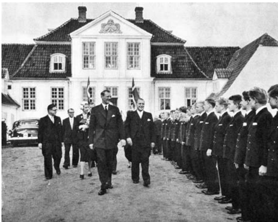
Indvielsen af Det Kongelige Opfostringshus med kongeparret som æresgæster.