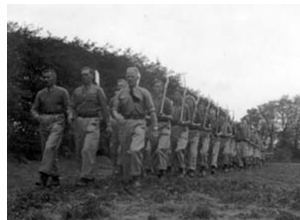
LAT på march.

LANDSARBEJDSTJENESTEN, forkortet LAT, var en ungdomsorganisation under DNASP oprettet i september 1940 og virkede til tjenesten blev opløst i