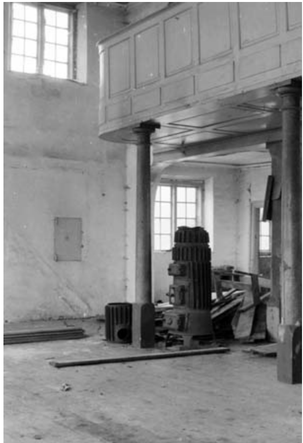
Det indvendige af kirken eller kapellet på Hellebækgård i 1946.

I Anledning af Hr. Grevens Brev til mig af 17' f. M. vedrørende Opmagasineringen af Deres Møbler paa gl. Hellebækgård, skal jeg tillade mig at meddele, at min Medvirkning var saa kortvarig, at det synes urimeligt, at De vil paalægge mig noget An-