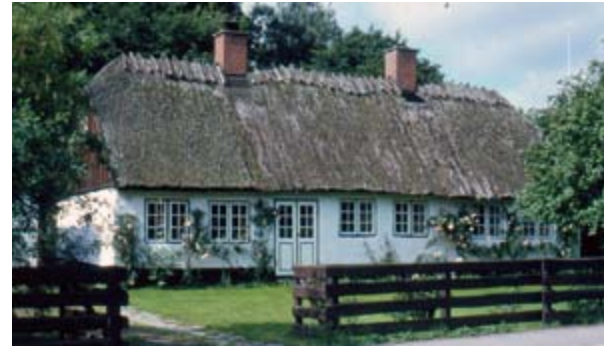
Lerhuset, Ndr. Strandvej 135. Foto: S.E. D-2152.

len med undtagelse af smedjen og en eventuel tilbygning dertil mellem smedjen og skrænten bagved op mod Blegebakkerne, som dog aldrig blev opført. Senere er der dog blevet bygget på matriklen.