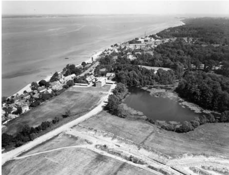
Skåningevej og Erik Gudmands Vej under anlæggelse. B614b.

Andelsboligforeningens første byggeri lå på Skåningevej, senere byggede de på Teglværksvej. Begge byggerier var afsluttet i slutningen af 1950'erne. Efter få år blev andelsboligerne på både Skåningevej og Teglværksvej solgt til andelshaverne som ejerboliger. Foreningen fik ved en vedtægtsændring mulighed for at bygge 3 socialfilantropiske boliger, som blev bygget på Erik Gudmands Vej. Senere kom flere til.