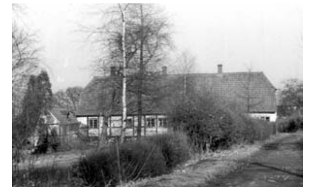
De Edssvornes Hus.