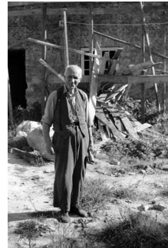
De sidste lettiske flygtninge boede på Hellebækgård medens man var i gang med ombygningen til DKO. B1591.