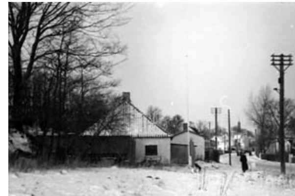
Hellebæk Smedje, Ndr. Strandvej 131.