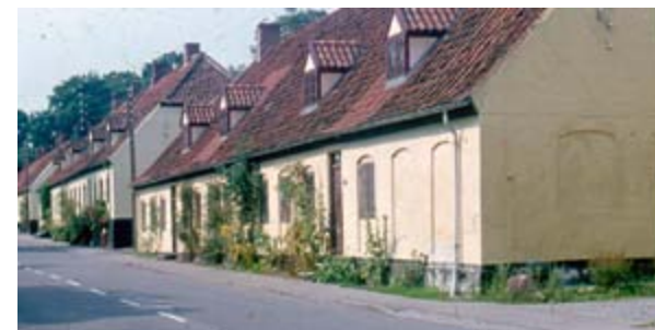
Hellebækgård Mejeri, Bøssemagergade 30. Foto: S.E. D-0506.

Ligeledes tabte andelsboligforeningen en retssag mod 2 beboere, som man opsagde, da de uden tilladelse havde fremlejet deres andelsbolig. Opsigelserne måtte trækkes tilbage.