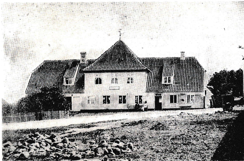
Hellebæk Kro o. 1850 (Bossemagergade)

månedlige gage som postmester er kr. 125,00 plus kr. 58,33 for at være telegrafbestyrer. Han flotter sig med køb af et sæt tøj til kr. 60,00 og en stråhat til 2 kroner.